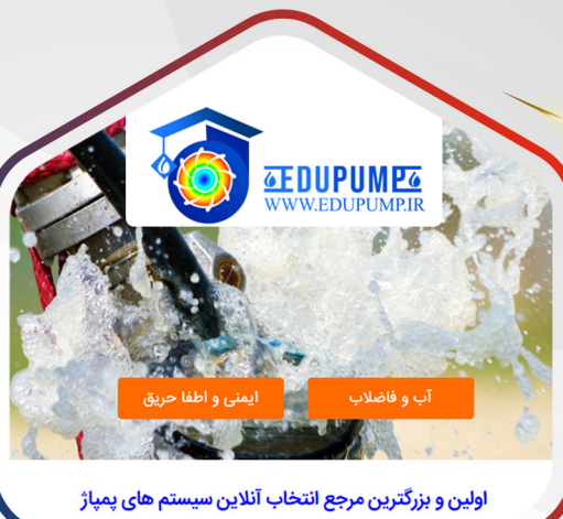
اولین و بزرگترین مرجع انتخاب آنلاین سیستم‌های پمپاژ

در کلاس‌های S3 - S2 - S1 مورد تایید سازمان آتش نشانی تهران